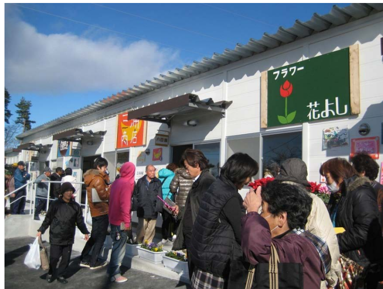
七の市商店街オープンの様子

⇒仮設店舗を中心に、お店の看板作りや商店街イベントへの手伝いを通じて、町民も外部ボランティアも一緒に応援の気持ちを形にすることができました。