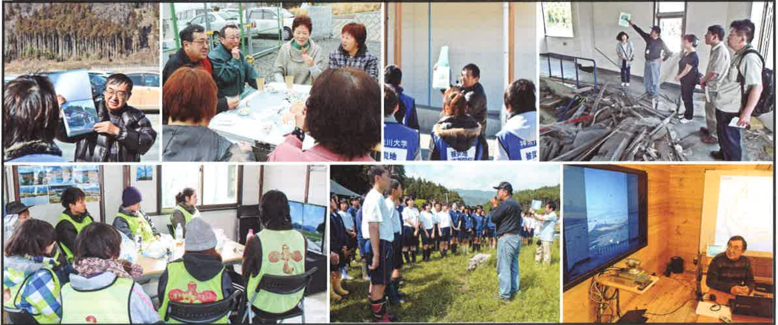
被災した行政の建物